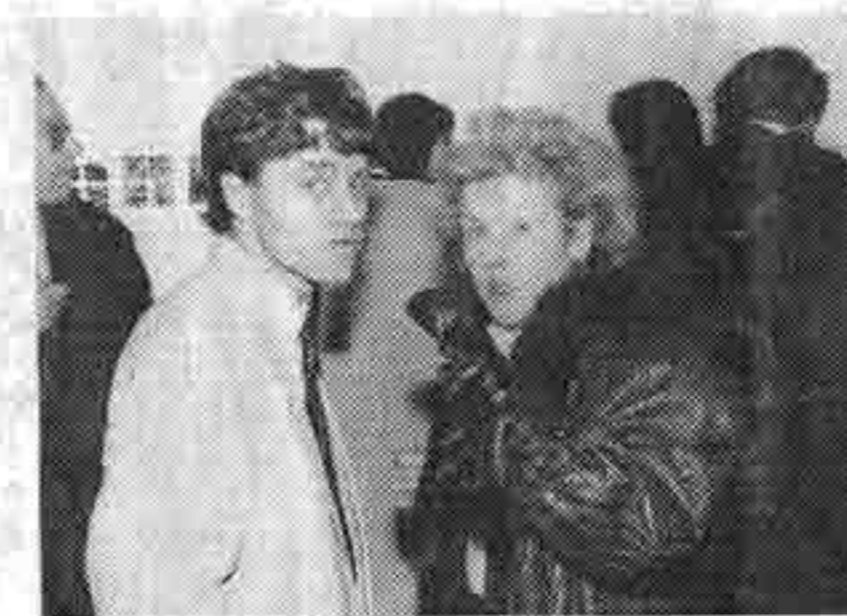
Presser, Mutter Musy.